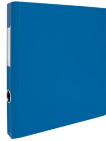
Cartable épaisseur 2 pouces