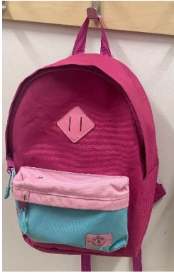
Sac à dos