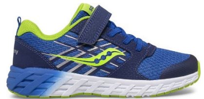
Espadrille pour la classe et le gymnase