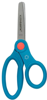
Ciseau avec poignée pour le pouce différente des autres doigts