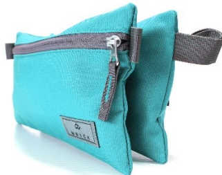
Étui à crayons double