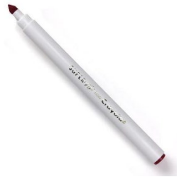
Crayons feutres à pointe moyenne